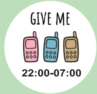
手機與3C產品就寢統一保管