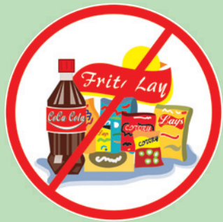
不能攜帶任何零食